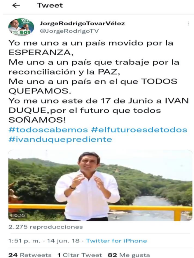
Ilustración 2: Cuenta personal de Tovar Vélez en la red social Twitter haciendo campaña electoral por Duque Presidente.